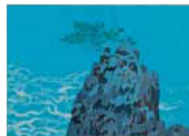
松と岩(木版画) "Reef with a Pine Tree"

唐招提寺障壁画「濤声」を再現した版画作品をはじめ、海を描いた作品を紹介します。日本各地を旅して描いた海のスケッチからは、波や岩礁を幾枚も描いて対象に迫ろうとする魁夷の静かな情熱が感じられます。