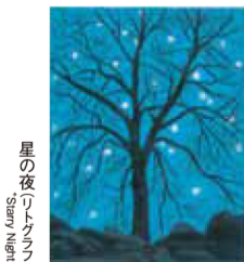
星の夜(リトグラフ) Moonlit Evening

天空を彩り天地を照らす、太陽、月、星が描かれた作品を展示します。輝かしい朝日や、山の端にかかる月など、刻一刻と変化してゆく風景の一瞬を描きながら、留まることのない悠久の時の流れを感じさせる作品の数々です。