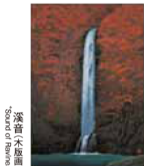
深音(木版画) Sound of Waterfalls

魁夷監修の木版画と、その制作に使用した貴重な版木を展示します。木の板に緻密な版を彫る彫師のわざ、一色ずつ摺り重ねる摺師のわざ。木版多色刷りの気の速くなるような作業工程と伝統の技術が、魁夷のいろを生み出しています。