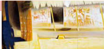
秋野不矩 土の祈り 1983年 [京都国立近代美術館] AKINO Fuku "Prayer on the Ground" 1983 The National Museum of Modern Art, Kyoto

した。制作の道は相反するも、ともに己に厳しく画業に専念した生き様と作品は、今なお、私たちの心に深く感銘を呼び起こします。本展では、まもなく生誕110年を迎えようとする二人の、画家として真摯に生きた道程を紹介します。