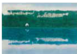
春映(リトグラフ) "Spring Reflections"

魁夷の描く風景画は、常に自然と一体であり、季節の移ろいと共にあります。「春愁」と「秋思」、「春映」と「冬映」など、季節や色彩などが対になる対比的な作品から、その際立つ美しさに迫ります。