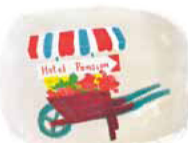
「北欧紀行 古き町にて」花飾り(リトグラフ) "Swag"

1962年、魁夷は夫人とともに北欧4カ国をめぐるスケッチ旅行に出かけました。美しい旅の思い出を綴った紀行文と挿絵で構成されたリトグラフ装画本「北欧紀行 古き町にて」を展示し、絵と文章で魁夷の旅を辿ります。