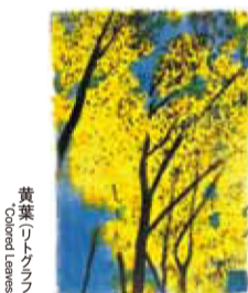
黄葉(コケシ) Yellow Leaves

豊かな自然を象徴する森林の風景、四季折々の樹木を描いた作品を紹介します。木陰や湖畔に腰を下ろし、時には寒さに凍えながら魁夷が眺めた樹々の姿。心地良い木漏れ日や鳥の声、踏みしめる落葉や雪の感触など、思いを巡らせながらご覧下さい。