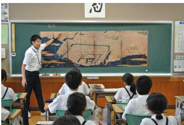
▲黒板に8曲のシートを貼り合せた状態