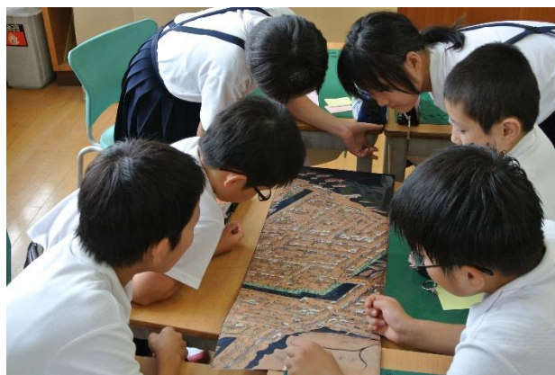
▲1曲ごとに分割して行うグループ学習