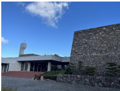
瀬戸内海歴史民俗資料館

活動内容：大崎ノ鼻から大崎展望台まで約1.5kmの山道を約2時間歩き、道中にある植物の種類や形状から昔の人々の暮らしのようすを推測します。午後の約2時間半は、瀬戸内海歴史民俗資料館内で資料見学を通し、人々の生活の変化や、環境問題について考えます。