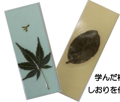
学んだ植物で しおりを作ろう！