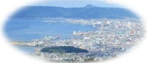
高松市街地や瀬戸内海の絶景！