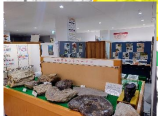
自然科学展示室の見学も！