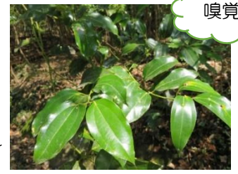
どこかでかいだことのあるにおいが…