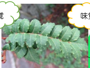
どんなにおいがするのかな？