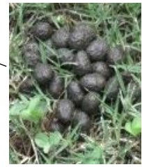
何か落ちてきているよ？