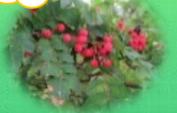
木の実発見！ 食べられる？