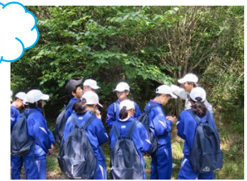
草笛づくり！ うまく鳴るかな？