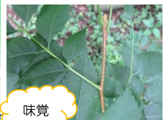
食べられる植物も！ どんな味かな？