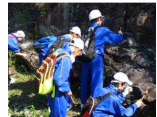
岩石を採取している様子