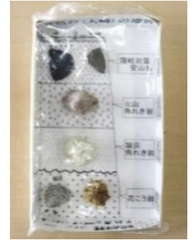
採取した岩石で作製したミニ標本