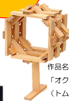
作品名 「オクタゴンマジック」 (トム・ブリューゲン)