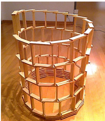
作品名「スパイラルタワー」 (フレデリック・マルタン)