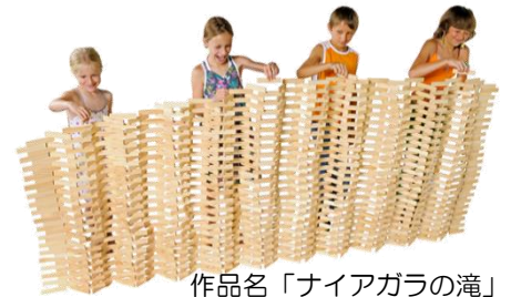
作品名「ナイアガラの滝」 (トム・ブリューゲン)