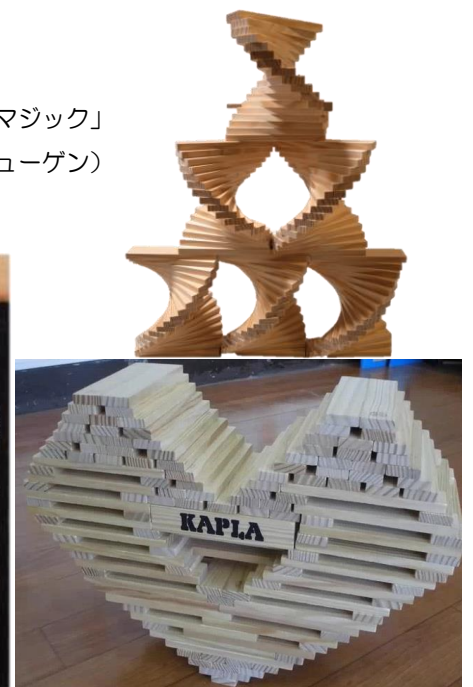
作品名「ハート」(ハナ・ブリューゲン)