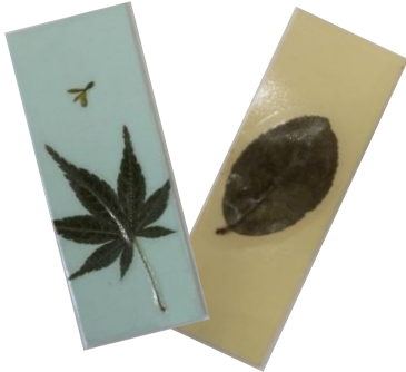
学んだ植物でしおりを作ろう！