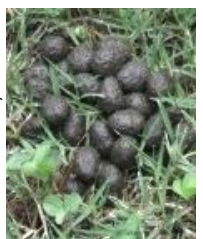
何か落ちてきているよ？