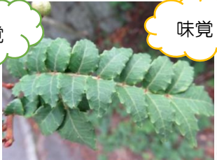
どんなにおいがするのかな？