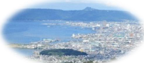
高松市街地や瀬戸内海の絶景！