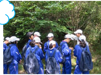
草笛づくり！ うまく鳴るかな？