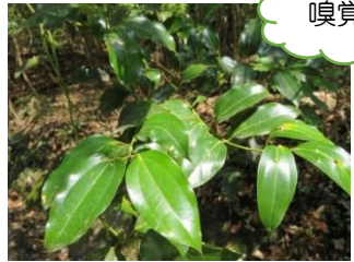
どこかでかいだことのあるにおいが…