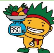
香川県がん対策イメージキャラクター 「ソウキくん」

国立がん研究センターが提案している「がんを防ぐための新12か条」は、がん予防のみならず、広く生活習慣病の予防にも効果が期待できます!