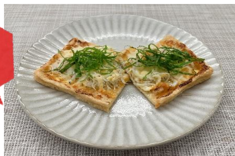
☆減塩レシピコンテスト 2022 入選作品