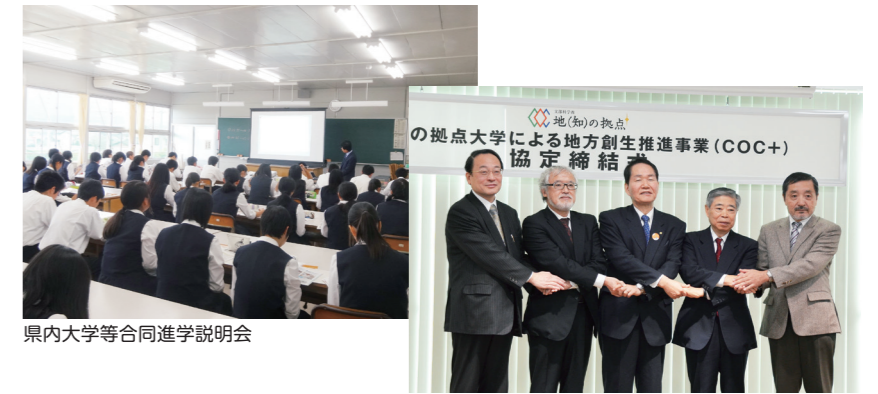
県内大学等合同進学説明会