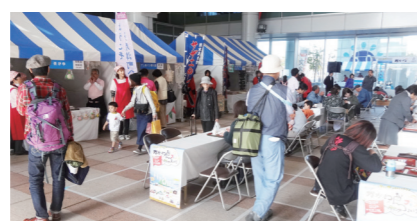
島のグルメや特産品、伝統芸能などを一堂に集めた「島フェスタ」