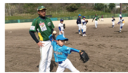
地域密着型スポーツ(香川オリープガイナース)