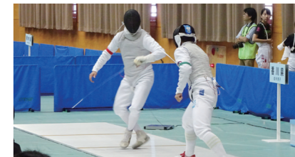
国民体育大会で活躍する郷土選手