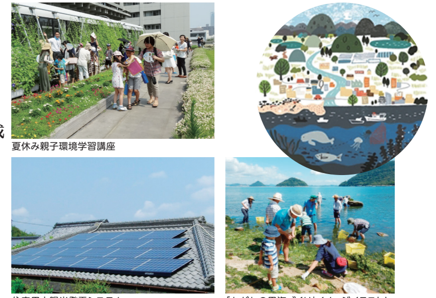
夏休み親子環境学習講座