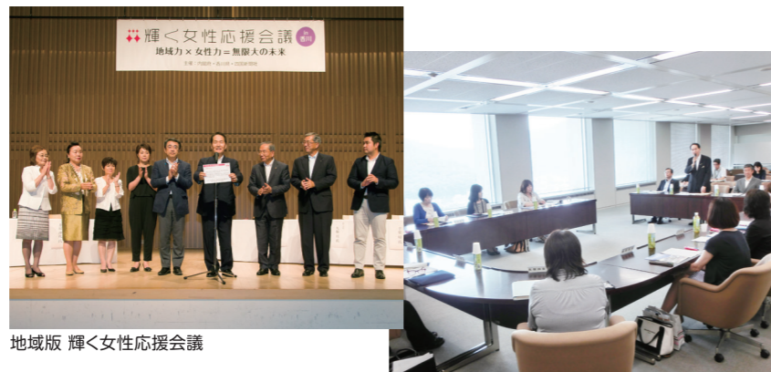
地域版 輝く女性応援会議