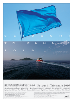
瀬戸内国際芸術祭2016 予告ポスターと会場マップ