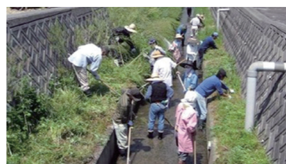
地域住民による協働活動(水路の泥上げ)