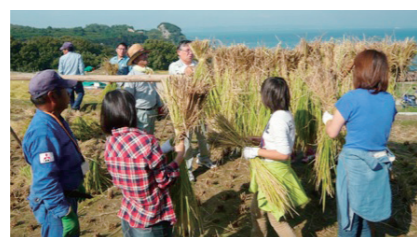
グリーン・ツーリズム(稲刈り体験)