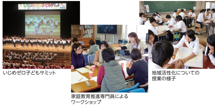
いじめゼロ子どもサミット