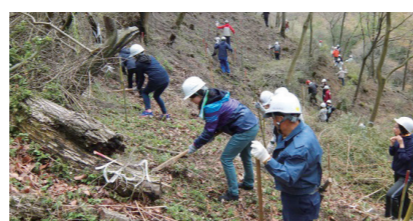
フォレストマッチング事業による植林