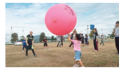
県民スポーツ・レクリエーション祭