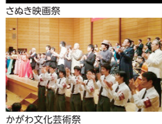
かがわ文化芸術祭