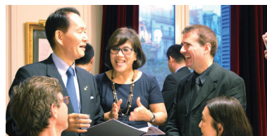
フランスでのトップセールス