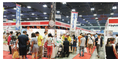
国際見本市での香川県のPR(シンガポール)