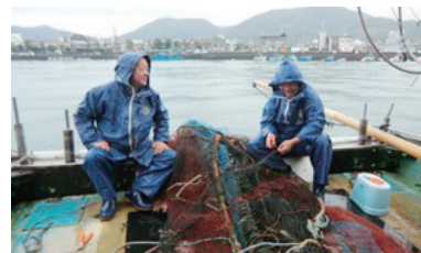
かがわ漁業塾(底びき網実習)