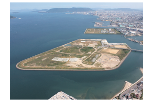
高松港西地区の産業基盤整備