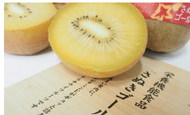
栄養機能性表示によるブランド力の強化(さぬきゴールド)