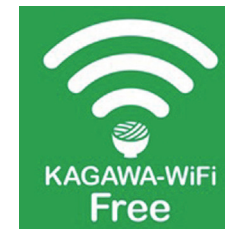
無料公衆無線LAN [かがわWi-Fi]