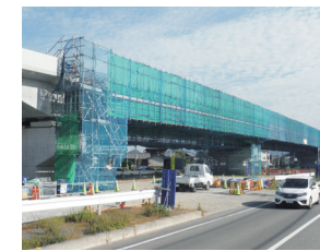
高松空港へのアクセス向上のための地域高規格道路