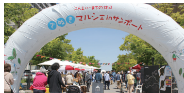
さぬきマルシェinサンポート