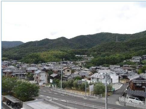
本校から保安寺を望む