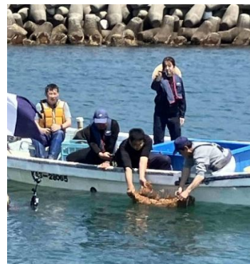
昨年の放流のようす