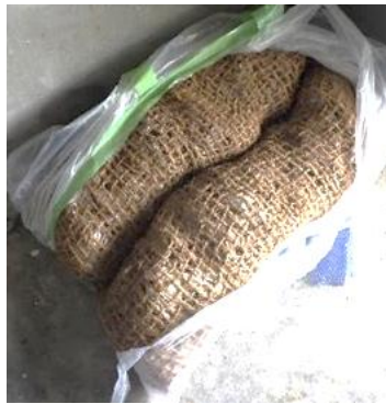
シェルター ※ヤシ殻ネットにカキ殻を詰めたもの