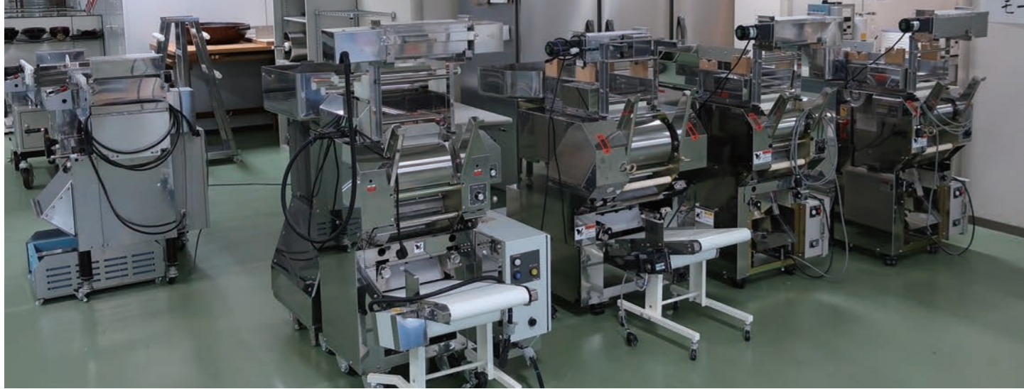
ずらりと並んだ製麺機。実際にお店で使うレシピでテスト製麺し、麺の仕上がりを確かめた上で、丁寧にクリーニングしてから納品する