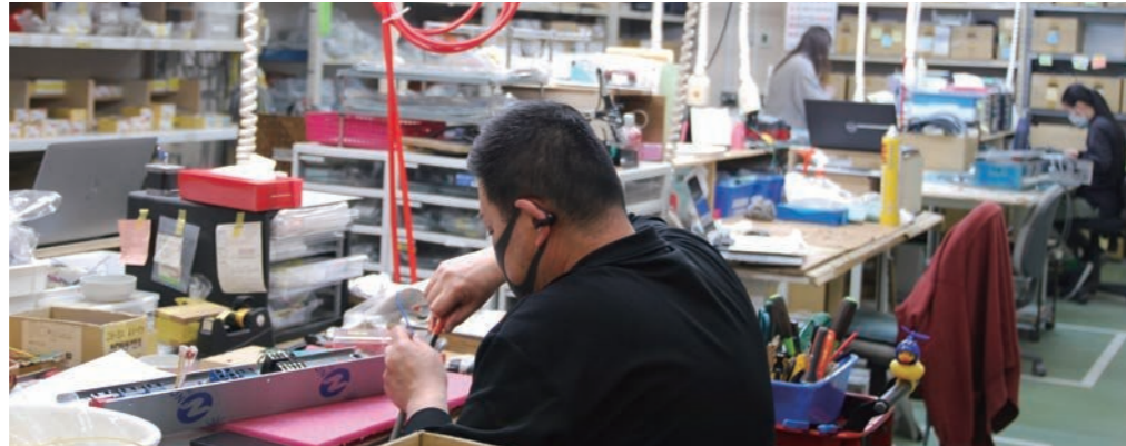
電設関係も社内にも専門部署を構えて一貫対応している