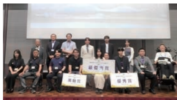
昨年度の表彰式の様子