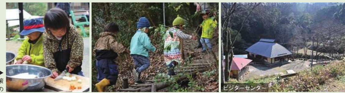
ビジターセンター

森の親子広場での一コマ▶ (中) 森の中を冒険気分でご散歩 (左) 包丁の使い方も慣れたもの