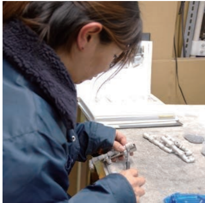
ゆで卵の殻をむく機械のパーツづくり