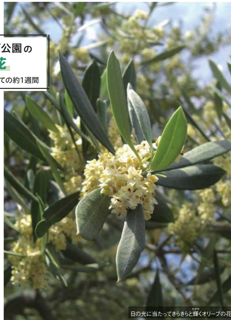
日の光に当たってきらきらと輝くオリーブの花

おが丘の上のギリシャ風車を囲むように広がる オリーブ畑。瀬戸内海を望む光景は小 豆島ならではの