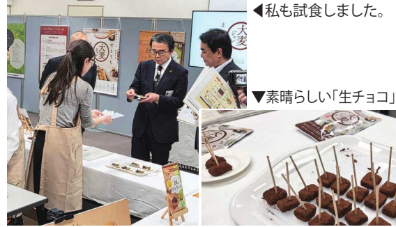
◀私も試食しました。

まず、はだか麦を独自製法で加工するとジェル状になります。そのジェルに抹茶やチョコの味付けをすると、なんと水ようかんのような食感になります。その味はほのかに麦の香ばしい香りがあり、舌触りも滑らかでなんとおいしい。次にこのジェルとチョコレートを1:1で混合してつくられた「生チョコ」。知らずに食べると、普通の生チョコと違いが分かりません。素晴らしい生チョコでした。さらに、はだか麦の粉を使用した蒸しパンの素は、水を混ぜて、レンジでチンするだけでおいしい蒸しパンが出来上がります。この蒸しパン