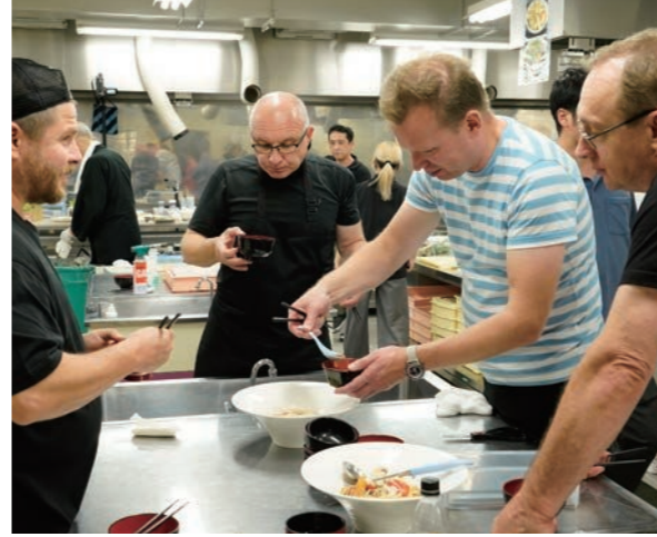
▼▲ 麺学校での実習の様子