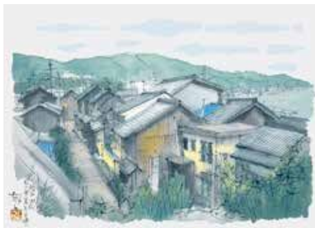
《瀬戸田町 私の実家のある通り》(「しまなみ海道五十三次」より) 1999年 紙本彩色 平山郁夫美術館蔵