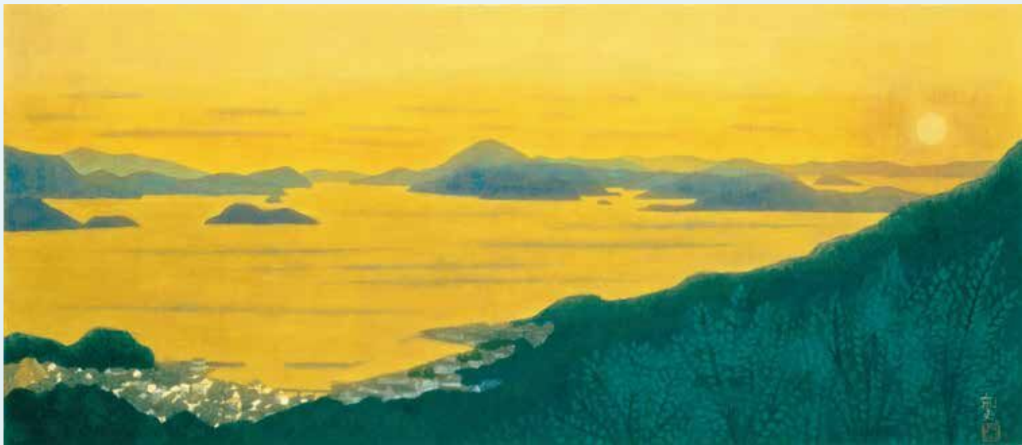
平山郁夫《燦・瀬戸内(輝く瀬戸内海)》1997年 紙本彩色 平山郁夫シルクロード美術館蔵