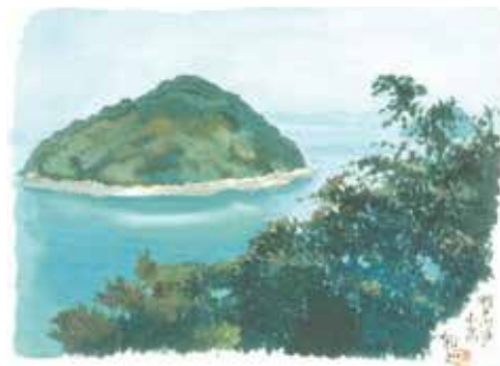
《瀬戸内海の小島》(「讃岐路」より) 1995年 紙本彩色 香川県立ミュージアム蔵