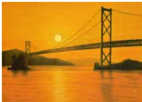
《因島大橋 夕陽》 1999年 紙本彩色 平山郁夫美術館蔵