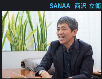
SANAA 西沢 立衛

世界的な建築家ユニットであるSANAA あなぶきアリーナ香川(香川県立アリーナ)の設計者であるSANAAのお二人に、アリーナ設計の思いや香川の魅力などを尋ねました。