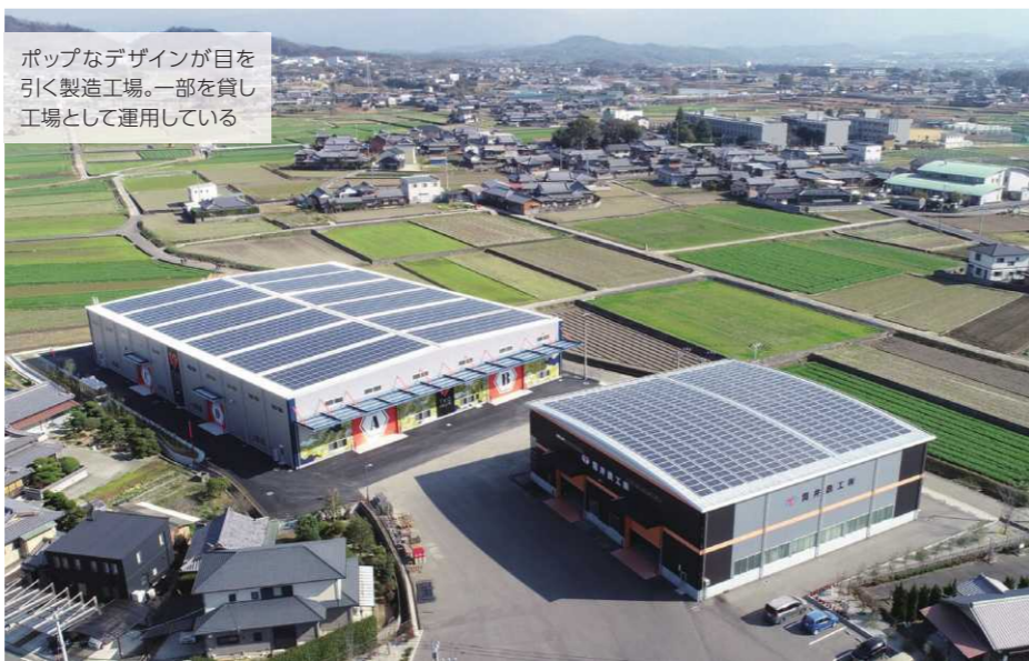
ポップなデザインが目を引く製造工場。一部を貸し工場として運用している