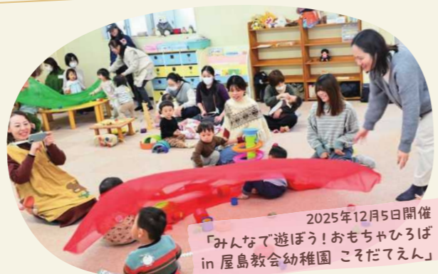
2025年12月5日開催 「みんなて遊ぼう!おもちゃひろば in 屋島教会幼稚園 こそだてえん」