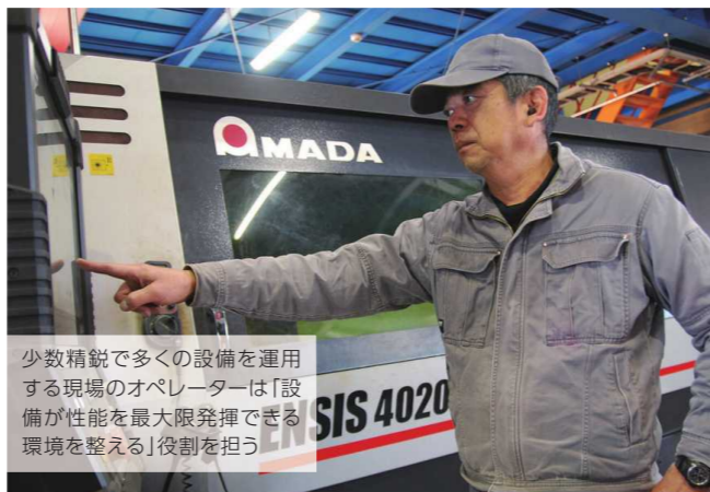
少数精鋭で多くの設備を運用する現場のオペレーターは「設備が性能を最大限発揮できる環境を整える」役割を担う