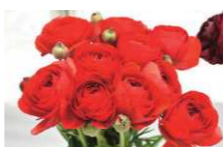
ランタンキュラス

県内選りすぐりの花々が一堂に会する「フラワーフェスティバル」。生産者が丹精込めて育てた切り花・鉢花の展示をはじめ、花き類の即売コーナーや体験型イベントなど、花の魅力をさまざまに体感できます。花いっぱい会場で、一足早い讃岐の春をお楽しみください。