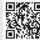
あなぶきアリーナ香川の魅力を動画でご紹介!

ユネスコ本部で2015年に創設され、毎年、世界の優れた建築物やインテリアを表彰する賞。美術館、ホテル、レストラン、スポーツ施設など8部門から、それぞれベルサイユ賞(最優秀賞)、エクステリア特別賞およびインテリア特別賞を選定。国内のベルサイユ賞は、17年の東急プラザ銀座(店舗・百貨店部門・東京)、20年のアマン京都(ホテル部門・京都)、24年の下瀬美術館(美術館部門・広島)に続いて4例目。