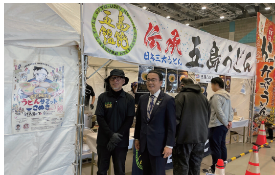
うどんファンで会場がにぎわいました

会場は午前9時の開場から多くの家族連れやカップルで大変にぎわいました。3枚1500円のチケットを買くと、どの店のうどんでも3杯食べられます。今年で12回目のイベントですが、今年は天候に