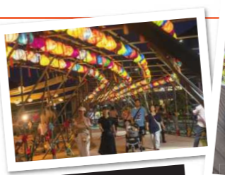
ベトナムマルシェ (瀬戸内国際芸術祭2025)

2025年の瀬戸内国際芸術祭でベトナムマルシェに出店。多くの方にベトナム料理を知ってもらえてうれしかったです。そのときの装飾品を思い出として店内に飾っています。