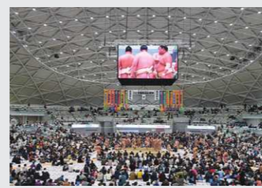
12月13日(土)には、令和7年 冬巡業 大相撲 高松場所が開催。8500人の観客が集まり、満員御礼となった