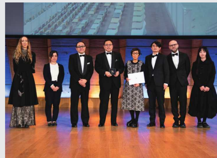
ユネスコ本部(フランス)での受賞式の様子

世界ベルサイユ賞機構からは、「既存の広場、公園、港を一体化し、街と海をつなぐアリーナ」として紹介されており、瀬戸内海に浮かぶ島々を想起させる緩やかな流線形の美しい外観、大きなピクチャーウィンドーに囲まれ、あらゆる方向から自然光が降り注ぐ屋内空間など、魅力的な施設として評価されました。