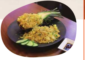
人気メニューの パイナップルチャーハン

主人が高松市内にベトナム料理店をオープンし、私が経営しています。主人と協力して子育てをしながら、2店舗を歩き来して掃除や接客、在庫管理、食材の下準備などをこなしています。「BACH HY(ひやくはい)」は、「本格的な味が楽しめる」とお客さまに喜ばれていますよ。ベトナムに行ったことのない方にも楽しく食事してもらえる店にしたいです。