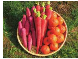
▲坂出市特産の「金時ミカン・金時ニンジン・金時イモ」3つを総称して坂出三金時

知事 法人による農業経営は、外国人との地域共生だけでなく、地元の方が参加しやすいという点でも重要だと考えています。機械導入などへの支援についても、これまで少しずつ進めてきましたが、来年度に向けてさらに拡充したいと考えています。