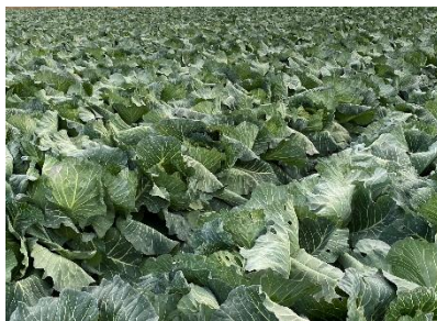
「キャベツ」栽培ほ場