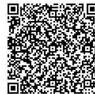
電子申請・届出システム

https://apply.e-tumo.jp/pref-kagawa-u/offer/offerList_detail?tempSeq=12126