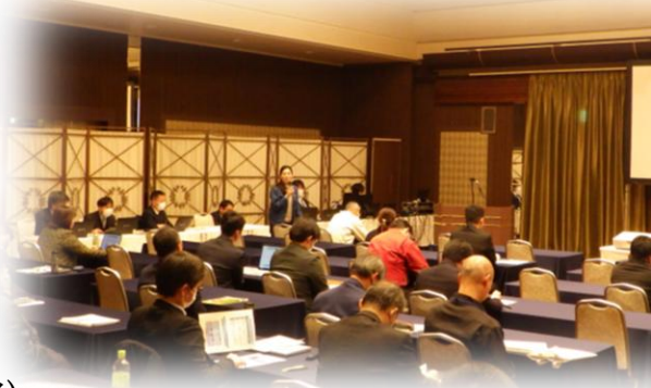
▲令和5年度セミナーの様子