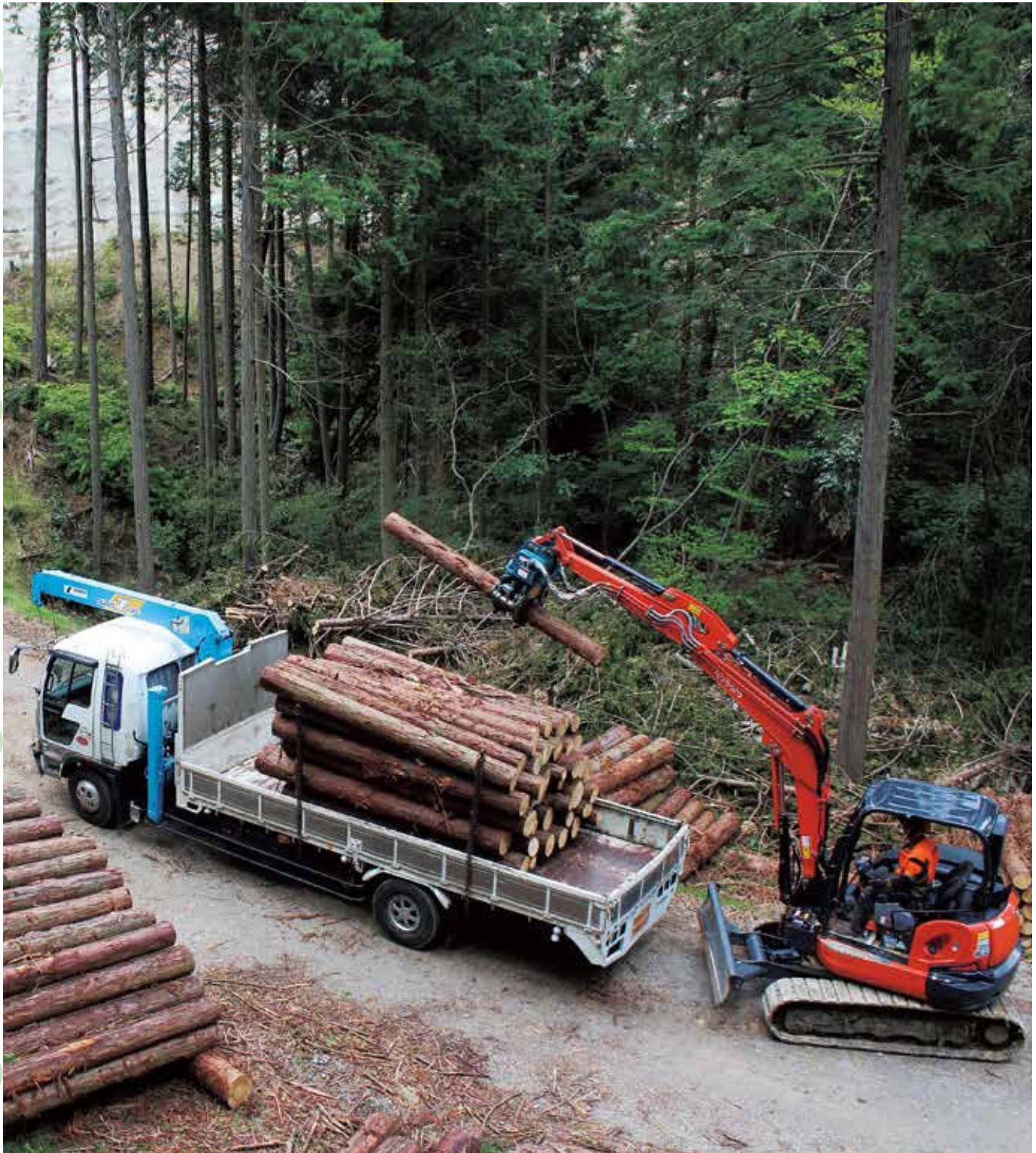
写真:琴南財田3-1号線で間伐した木材をトラックで運び出す様子