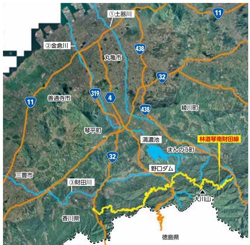
■主要な河川の上流域に位置する琴南財田線周辺の森林(図)