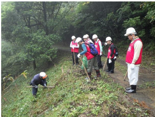
<作業方法を学ぶ参加者>