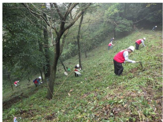
<滑らないように気を付けて作業をします>

参加者は3つのグループに分かれた後、県職員、香川西部森林組合職員の指導を受けながら、森づくり作業に取り組みました。