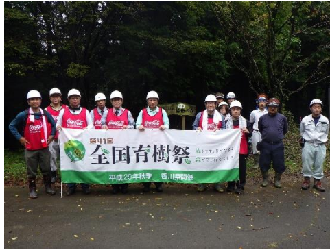
<参加者の皆様で記念撮影>

今回は、第1回、第2回の森づくり活動で植林を行った場所のうち、活着が不十分な箇所にはヤマザクラ 100 本を補植しました。