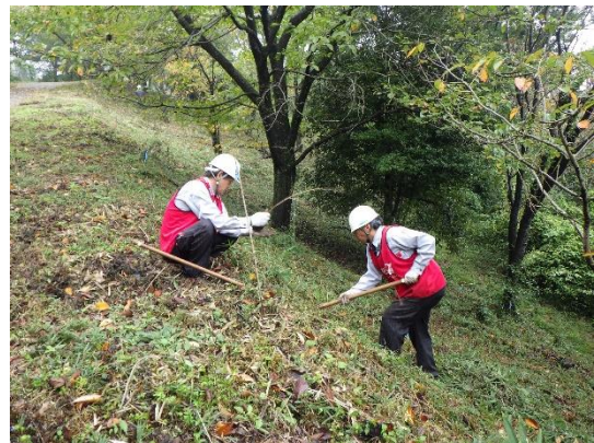
<植穴を掘るのは大変です>