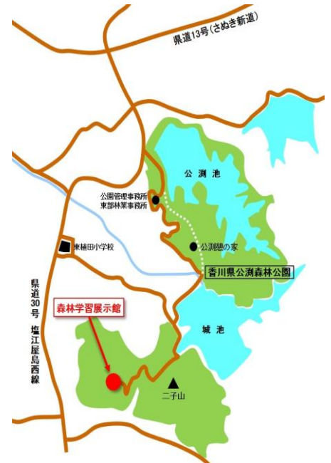
公洲森林学習展示館 地図

今年度から、森林学習展示館を活用して、森づくり活動の人材を発掘するための講座を行うとともに、管内の展示物を順次整備する予定です。