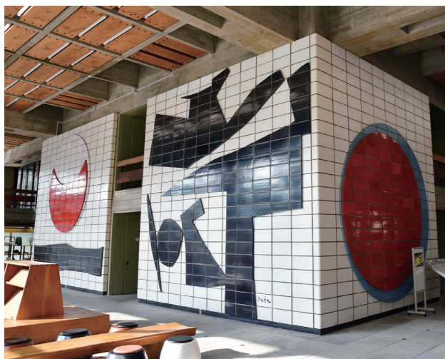
1階ロビーにある猪熊弦一郎の「和敬清寂」