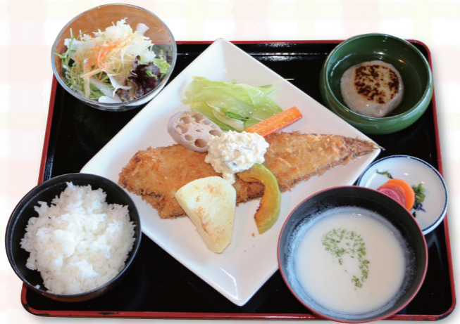
島キッチンセット

「食とアート」で人々をつなぐ出会いの場として、瀬戸内国際芸術祭2010にできました。豊島で採れた米や野菜をふんだんに使った「島キッチンセット」は、東京・丸の内ホテルのシェフのアドバイスのもと、地元のお母さんのアイデアと愛情がこもった人気メニューです。食材も地元の人が提供してくれたものが多く、島の人たちも店を盛り上げてくれています。