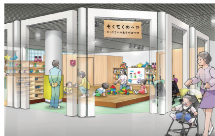
児童館1階西側(イメージ)

開園25周年を機に、わくわく児童館1階の屋内展示を更新し、3月1日(日)にリニューアルオープンします。