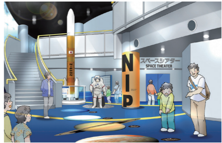
児童館1階東側(イメージ)