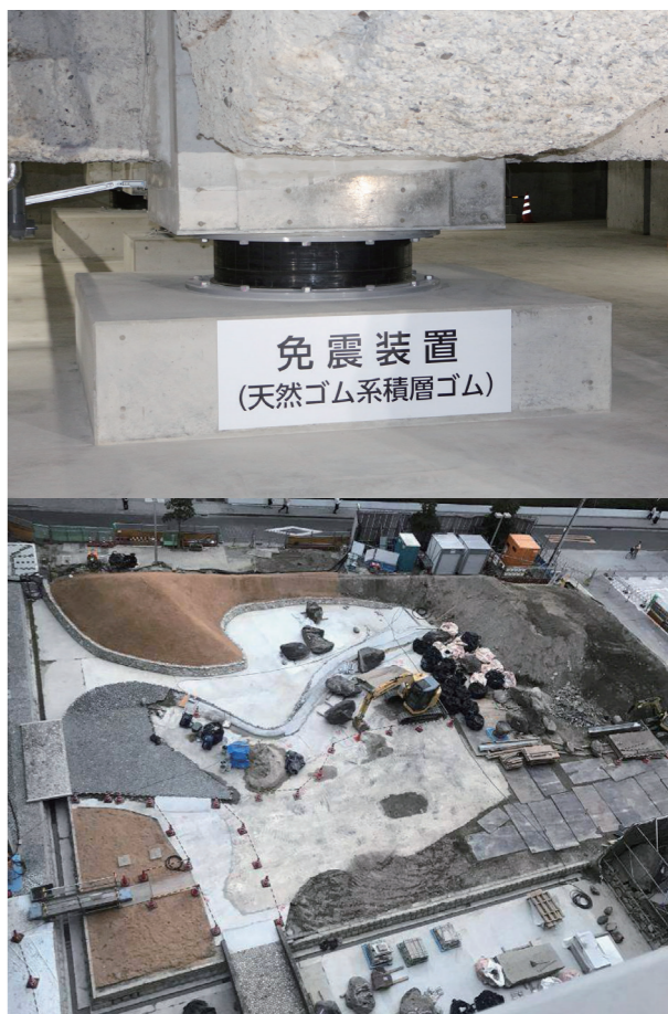
免震装置(写真上) 南庭の復旧工事(写真下)