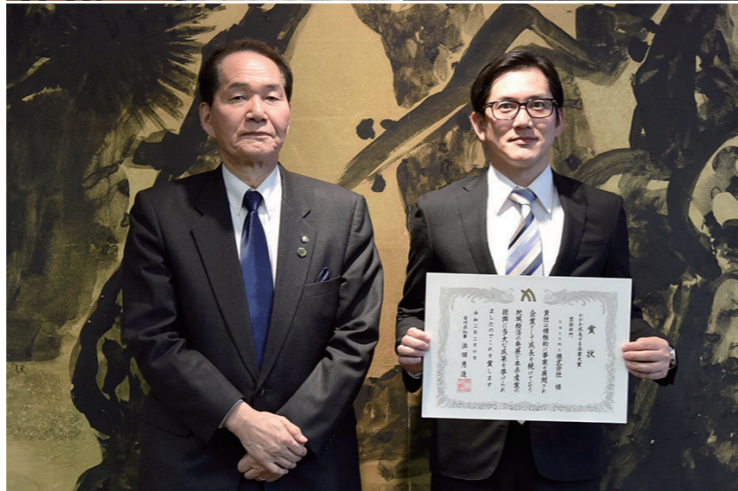
かがわ成長する企業大賞表彰式