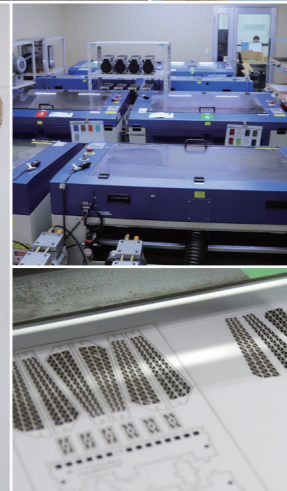
レーザーカット加工