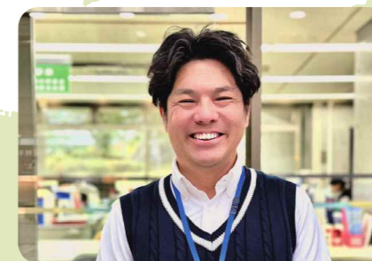
善通寺市社会福祉協議会の支援員