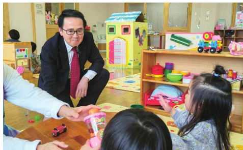
子育て支援センターしいのきにて

今の子育て中のお父さんやお母さんは大変孤独だと聞きます。以前は同居や近くのおばあちゃんやおじいちゃんなど相談に乗ってくれる方がいましたが、最近はマンションが増えたりして、そのような周辺の手助けが難しくなっていることも影響しているでしょう。