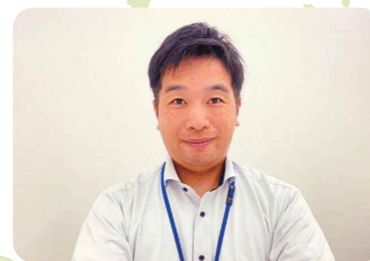
善通寺市社会福祉課の支援員