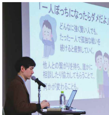
ささらぎさんが自身の体験談を発表した講演会

この17年間が自分にとって必要な時間だったか今は分かりませんが、私の体験が、心が疲弊してつらい思いをしている他の誰かに役立つかもしれない。この17年間が必要だったと言えるよう、これからの人生を歩んでいきたいですね。多くの人と関わってきたいし、何より心配を掛けた両親に親孝行をしたいと思っています。