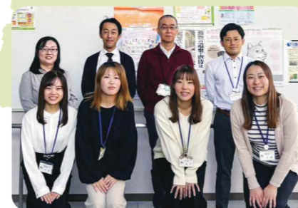
東讃保健所の支援員の皆さん