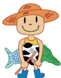
かがわ「地産地消」運動 イメージキャラクター さんた 「 讀太くん 」

1 3年未満 6.4% 2 3年以上～10年未満 12.6% 3 10年以上～20年未満 14.9% 4 20年以上 61.9% 無回答 4.2%