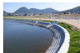
▲三井新池（多度津町）