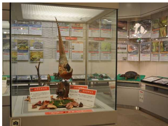
▲まちかど生き物標本展