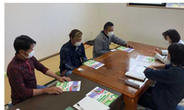
▲農業支援グループ設立に向けた話し合い

認定農業者の確保・育成と集落営農の組織化・法人化を推進するとともに、県外からの移住就農や農外企業の参入など多様なルートからの新規就農の促進、農業支援グループの組織化支援など、地域の実情に即した多様な担い手づくりを推進しました。