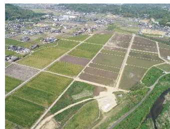
▲生産性が向上した農地 （綾川町羽床下地区）