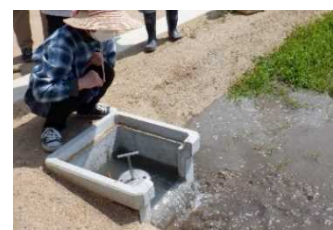
▲パイプラインによる給水