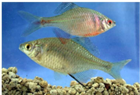
▲ニッポンバラタナゴ