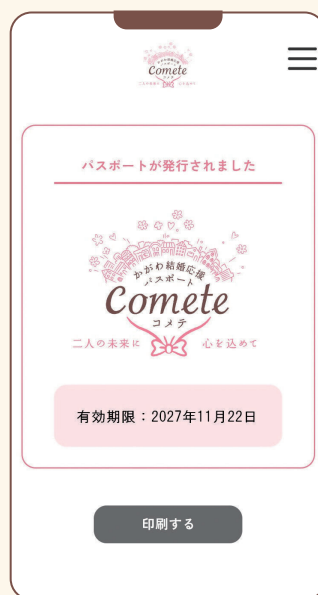
▲スマホでのパスポート表示イメージ

※優待サービスは、協賛店のご厚意により、独自に提供されるものです。 割引や無料サービス、ポイント付与など、協賛店ごとに設定されます。