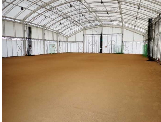
災害緊急物資の荷捌場の確保