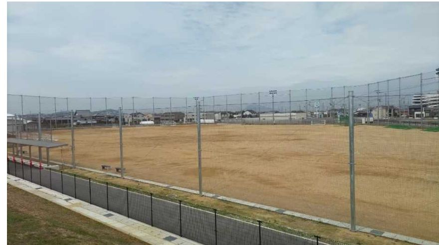
災害時の救援隊等の集結地、災害緊急物資の搬入・搬出のための大型車両等駐車スペースの確保(89台分)