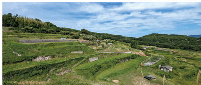
棚田ライトアップ 棚田の畦畔を総延長2.2kmにわたってソーラー式センサーライトで彩ります。