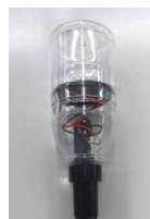
ソーラー式センサーライト ペットボトル 日没後に自動点灯し、15分ごとに赤、青、緑、金の4色に変化します。