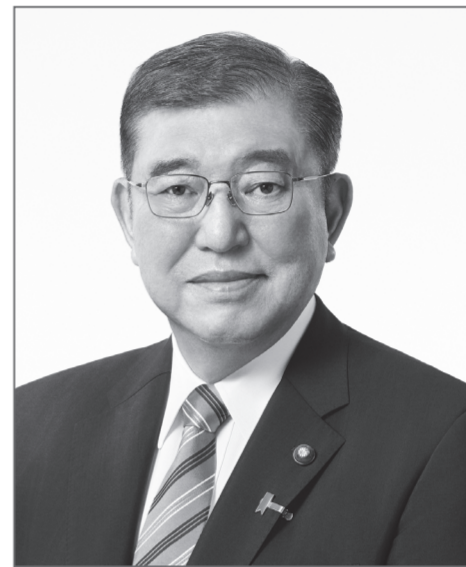
自由民主党総裁 石破 茂