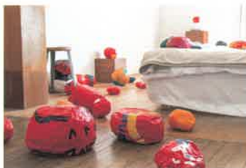
なんでそんなんEXPO, 2021年