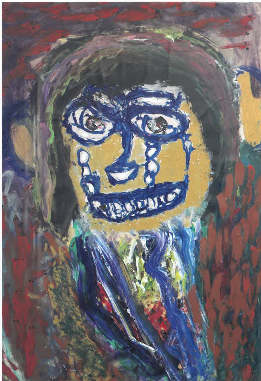
「笑、泣、怒の真実像」飛田河郎 2016年