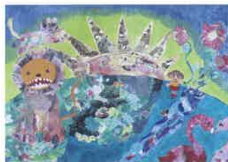
【地球にやさしく】Hello House こがも, 2022年