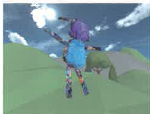
パッスレルメタパスプロジェクト, 2023年