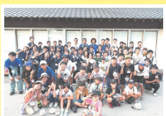
なおしま自然探検隊 (ういらぶ・なおしま)