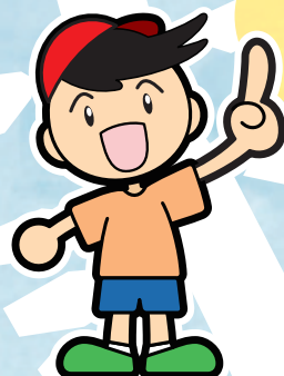
直島町観光キャラクター「すなおくん」

クイズラリーでゴールすると ゴミ袋をプレゼント! (なくなり次第終了とさせていただきます)