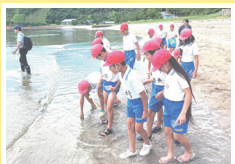
小学校環境教室 (エコアイランドなおしま推進委員会)