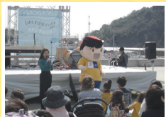
環境フェスタ (エコアイランドなおしま推進委員会)