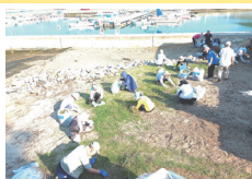
ごみ0クリーンデー (環境水道課)