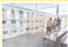
エコTシャツアート展 (ういらぶ・なおしま)

自然とアートと環境の島“直島”は全国で15番目のエコタウン事業の承認を受けています。エコアイランドなおしまとして、循環型社会のモデル地域とすることを目的に様々な活動をおこなっています。