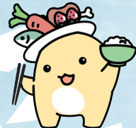
香川県食品ロス削減推進キャラクター「たるる」