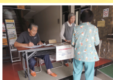
花の球根配布 (エコアイランドなおしま推進委員会)