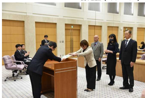
第2回 認定証授与式の様子