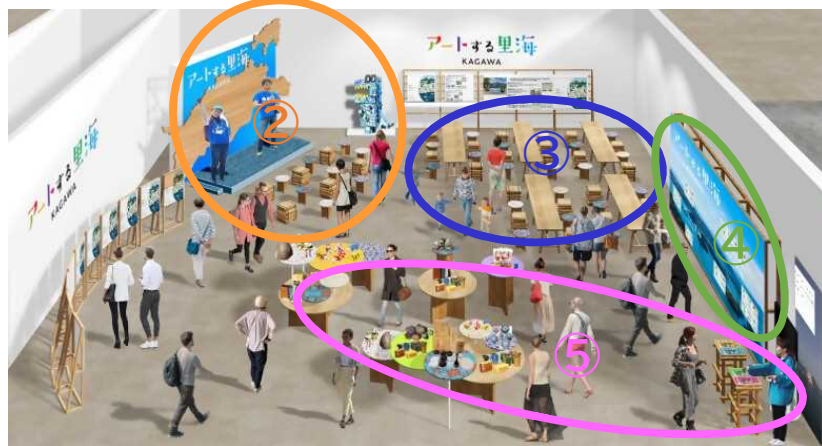
(屋内展示イメージ)