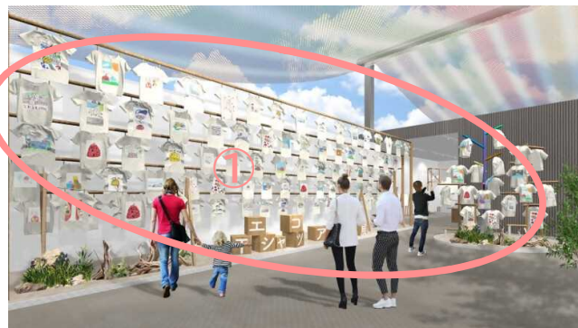
(屋外展示イメージ)