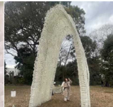
(東京藝大連携イメージ) 海ゴミ(発泡スチロール、廃棄漁網等) を使用したアート作品