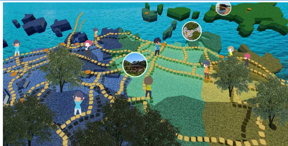
(メイン空間イメージ)

バーチャル空間で、イベントの開催、コンテンツの展示等に活用でき、法人・個人問わず、様々な業界の方にご活用いただけるサービスです。 https://door.ntt/