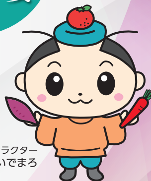
坂出市公認キャラクター さかいでまる