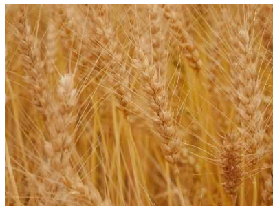
新品種「さぬきの夢2023」