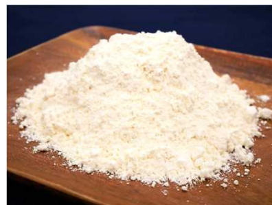
「さぬきの夢」小麦粉