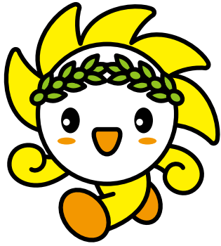
香川県人権啓発 マスコットキャラクター 人権かがやきくん