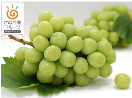
さぬき讚フルーツ 「シャインマスカット」