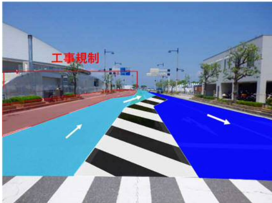
フェリー乗り場付近（北向き）