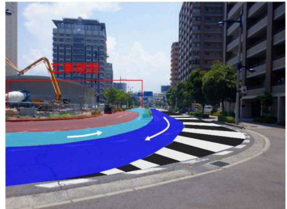
県立アリーナ北西付近（南向き）