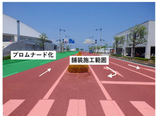
県立アリーナ周辺道路 [東側]