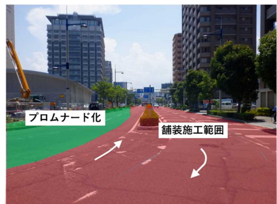
県立アリーナ周辺道路 [西側]