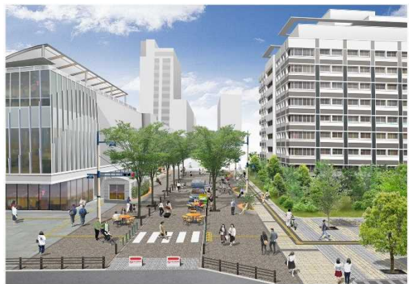
整備イメージ (土日祝日の午前9時～午後9時) ※