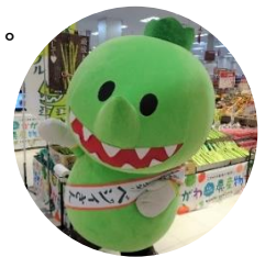
香川県産野菜イメージキャラクター ベジィさん