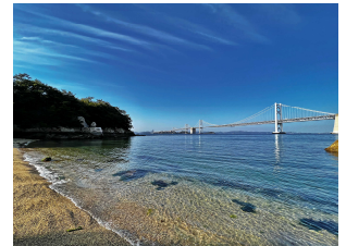
最優秀賞「なぎさ海道」