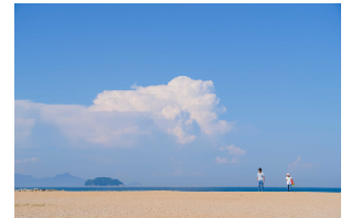
優秀賞「青い風に吹かれて」