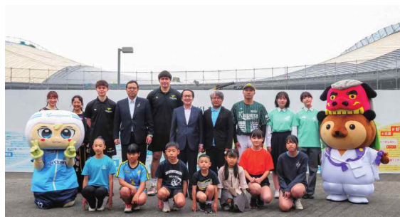
プレオープンイベント(第1弾)にて

このアリーナの外観は、世界中見渡してもどこにもない形をしています。私も多くのVIPの方を建築現場に案内していますが、「オーストラリアのシド