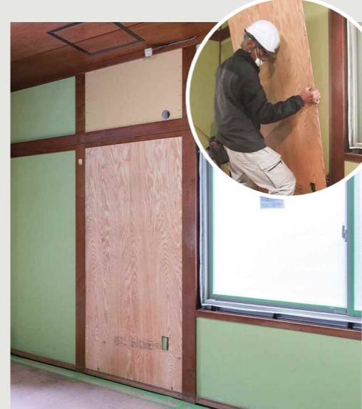
▲T様邸 昭和50年(1975年)建築、木造2階建て