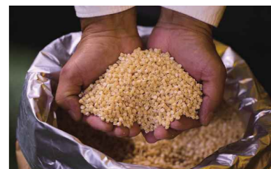
バイオマスプラスチック

（住所）観音寺市豊浜町和田乙1248番地3 （創業）1967年 （設立）1986年 （従業員数）44人 ☎0875-52-2929 https://kawasakikako.co.jp/