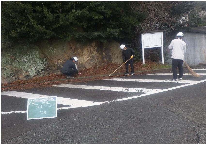
活動報告 (R7) 道路清掃活動