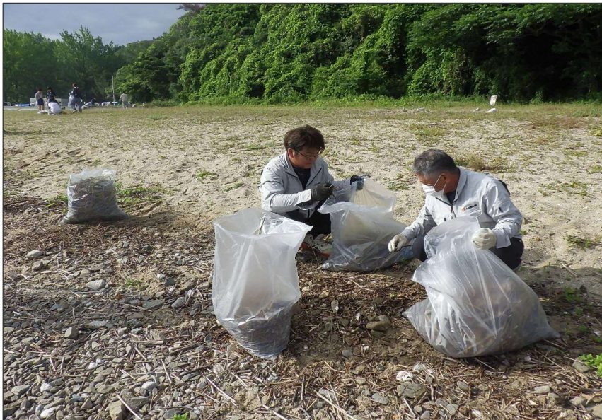
活動報告 (R7) さぬキラ