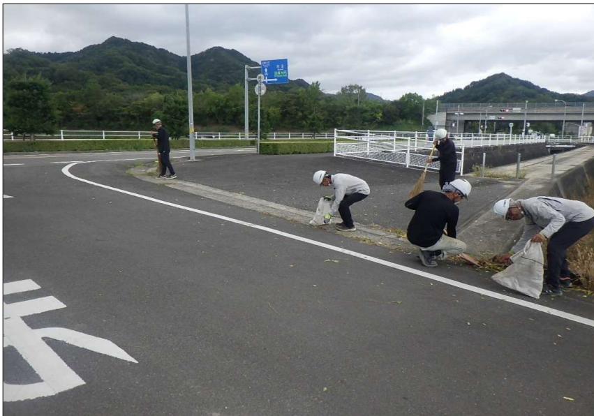
活動報告 (R7) 道路清掃活動