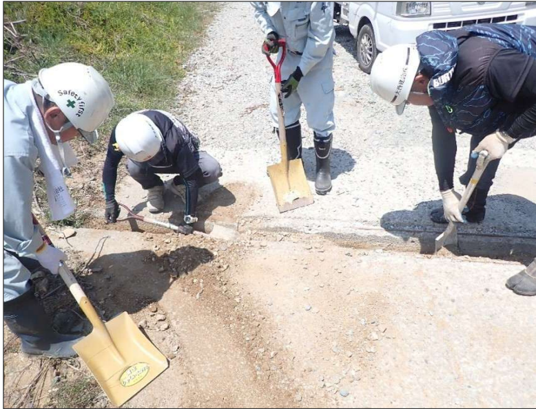
活動報告 (R7) 森林ボランティア