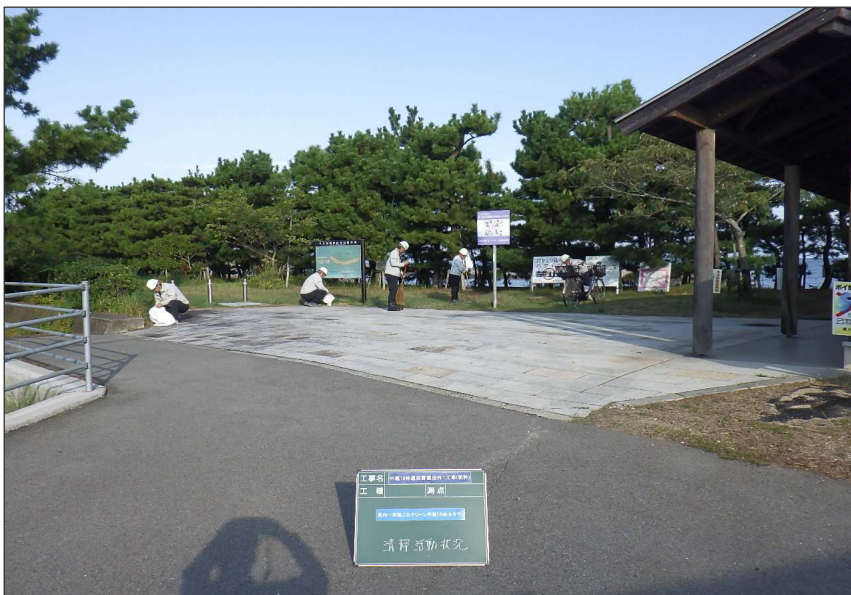
活動報告 (R7) さぬキラ