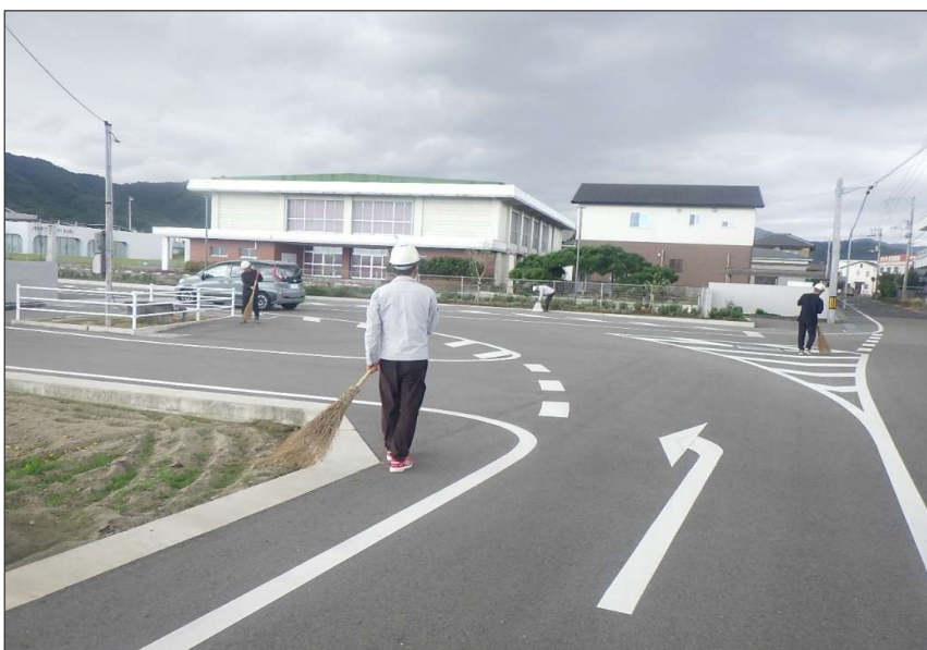
活動報告 (R7) 道路清掃活動