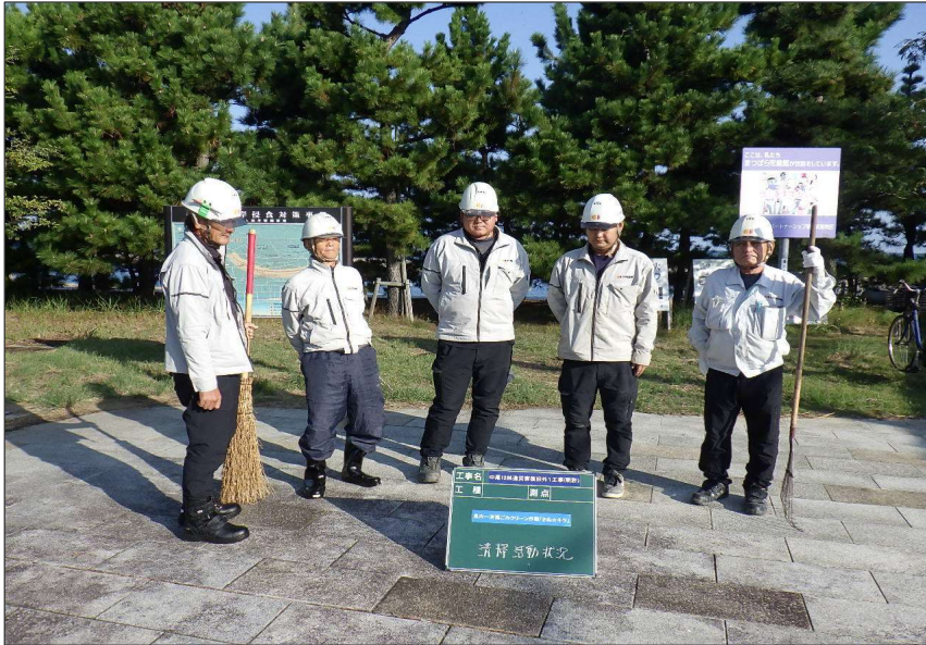
活動報告 (R7) さぬキラ