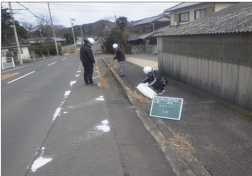
活動報告 (R7) 道路清掃活動