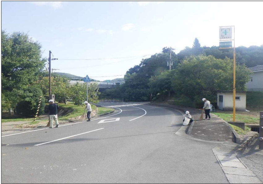
活動報告 (R7) 道路清掃活動