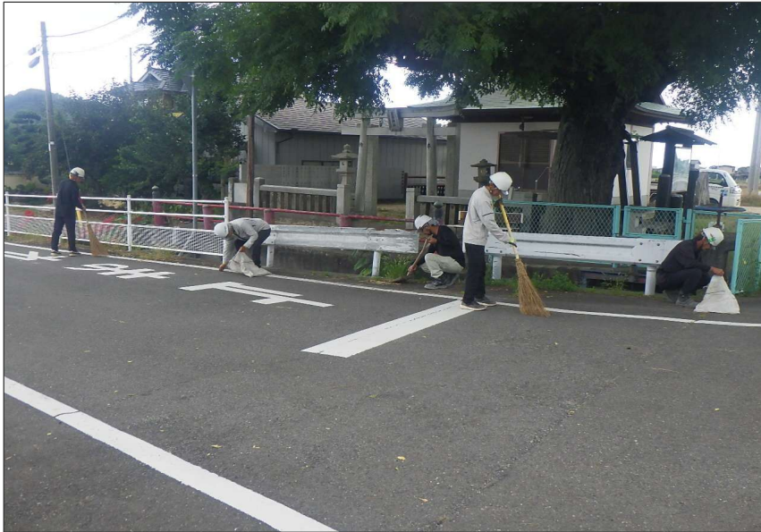
活動報告 (R7) 道路清掃活動