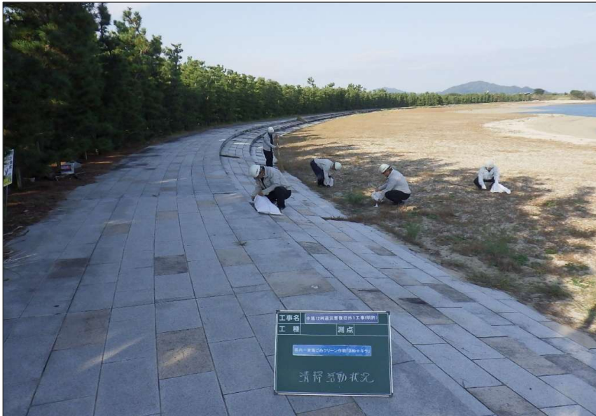
活動報告 (R7) さぬキラ