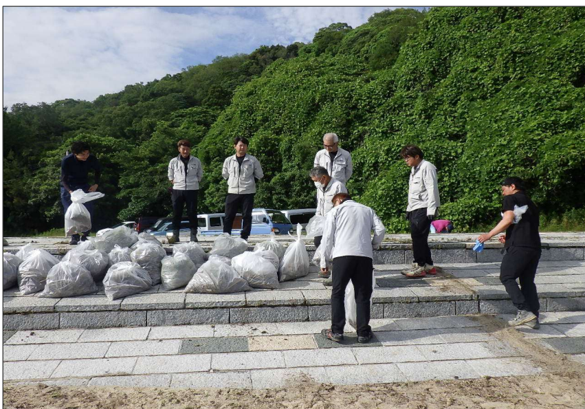
活動報告 (R7) さぬキラ