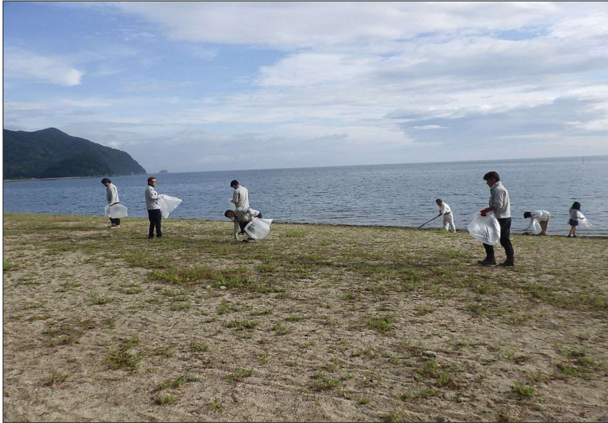
活動報告 (R7) さぬキラ