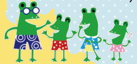
節水キャラクター ケロくんファミリー