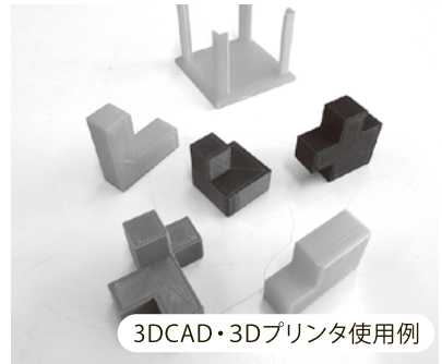
3DCAD・3Dプリンタ使用例