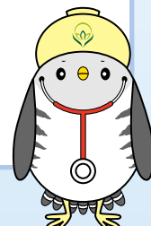
大学キャラクター 「ほいほいさん」

希望者には、在学生や教職員が相談に応じます。入試のこと、教育内容のこと、大学生活のことなど、疑問や不安にお答えします。