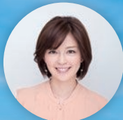
司会 フリーアナウンサー 中野 美奈子