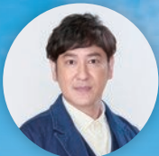
トークセッション