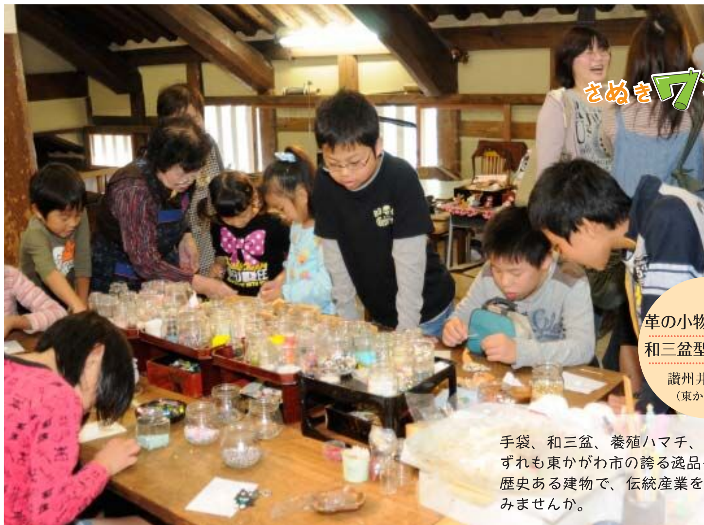
世界で一つだけの小物を作ろう

手袋、和三盆、養殖ハマチ、しょうゆ、いずれも東かがわ市の誇る逸品ぞろい。歴史ある建物で、伝統産業を楽しく学んでみませんか。