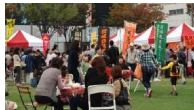
多くの来場者でにぎわう「さぬきうまいもん祭り in 中讃」(丸亀市)

こうした状況を踏まえ、県は認知度や魅力の向上と販路開拓・販売力強化を目指し、PR活動を展開しています。 県外向けには、トップセールスに力を入れるとともに、「アンテナショップ」「せとうち旬彩館」をはじめ三越伊勢丹、丸ノ内ホテルなど大都市圏の大手百貨店やホテル、量販店、飲食店での県産食材フェアを積極的に実施。さらにアジア市場も視野に入れ、海外の百貨店などと連携した新たな輸出ルート開拓などの取り組みを進めています。 また、10月には県産品のポータルサイト「LOVEさぬき」