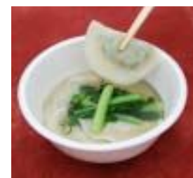
「さぬきスープ餃子食べて菜」 (レシピは11ページ参照)

「さぬきスープ餃子食べて菜」の魅力をたっぷりの一品です。同校では2年前から県産食材