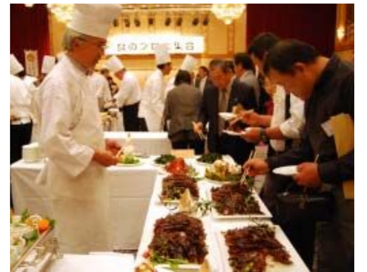
プロの料理人のアイデア料理を試食

県産食材にこだわる店舗を「さぬきダイニング」「さぬきの食提店」としてプロデュース。PRするなど、多方面から香川