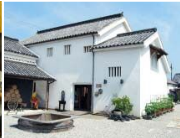
讃州井筒屋敷「三之蔵」

古くから商業で栄えた「風待ちの港」、東かがわ市引田。和三盆、養殖ハマチ、手袋など全国に誇る伝統産業が今も息づくまちです。 歴史の薫る路地の一角、白壁がまぶしい讃州井筒屋敷は、江戸時代の商家を活用した観光交流施設です。にぎわいの発信拠点として平成17年にオープンしました。地場産品のショップや個性豊かな店が並び、母屋は重厚な雰囲気を生かした展示スペースに。「オリジナル手袋づくり」や「現代風着付けでまち並み散策」など、地域の産業や文化に触れる体験メニューも豊富です。 「インターチェンジや駅からのアクセス