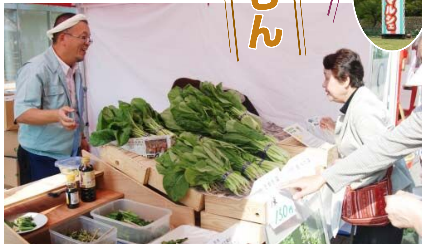
生産者と直接交流できる「さぬきマルシェ」