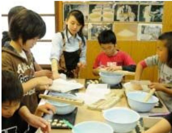
壊れやすい和三盆、やさしく扱おう