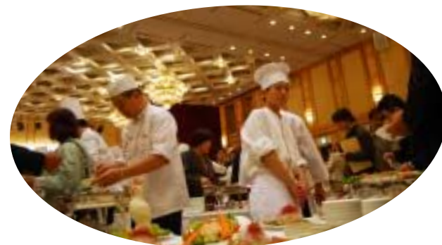
新メニューを披露する「食のプロ大集合」