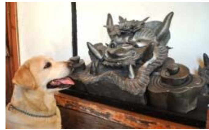
神内さんの工房にはこんなに大きな鬼瓦があるよ!(三木町・讃岐装飾瓦Onuma)