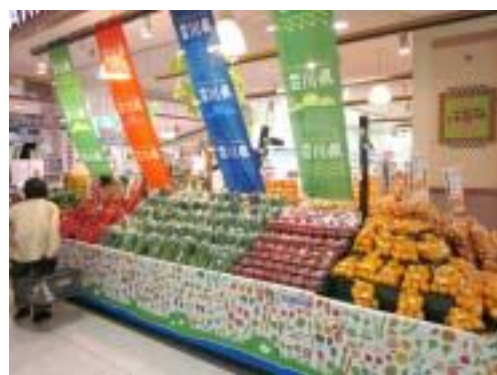
大手スーパーでの県産品フェア(京都府)