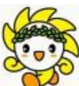
人権かがやきくん

人権週間を機に、相手の気持ちを考え、思いやることの大切さについて考えてみませんか。県民一人一人の人権