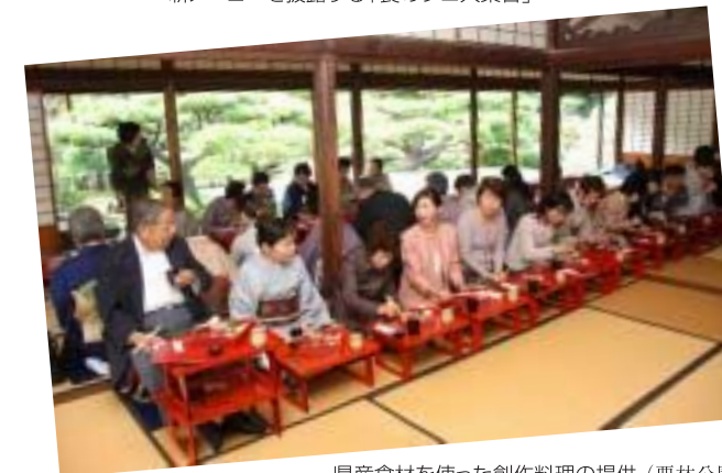
県産食材を使った創作料理の提供(栗林公園)